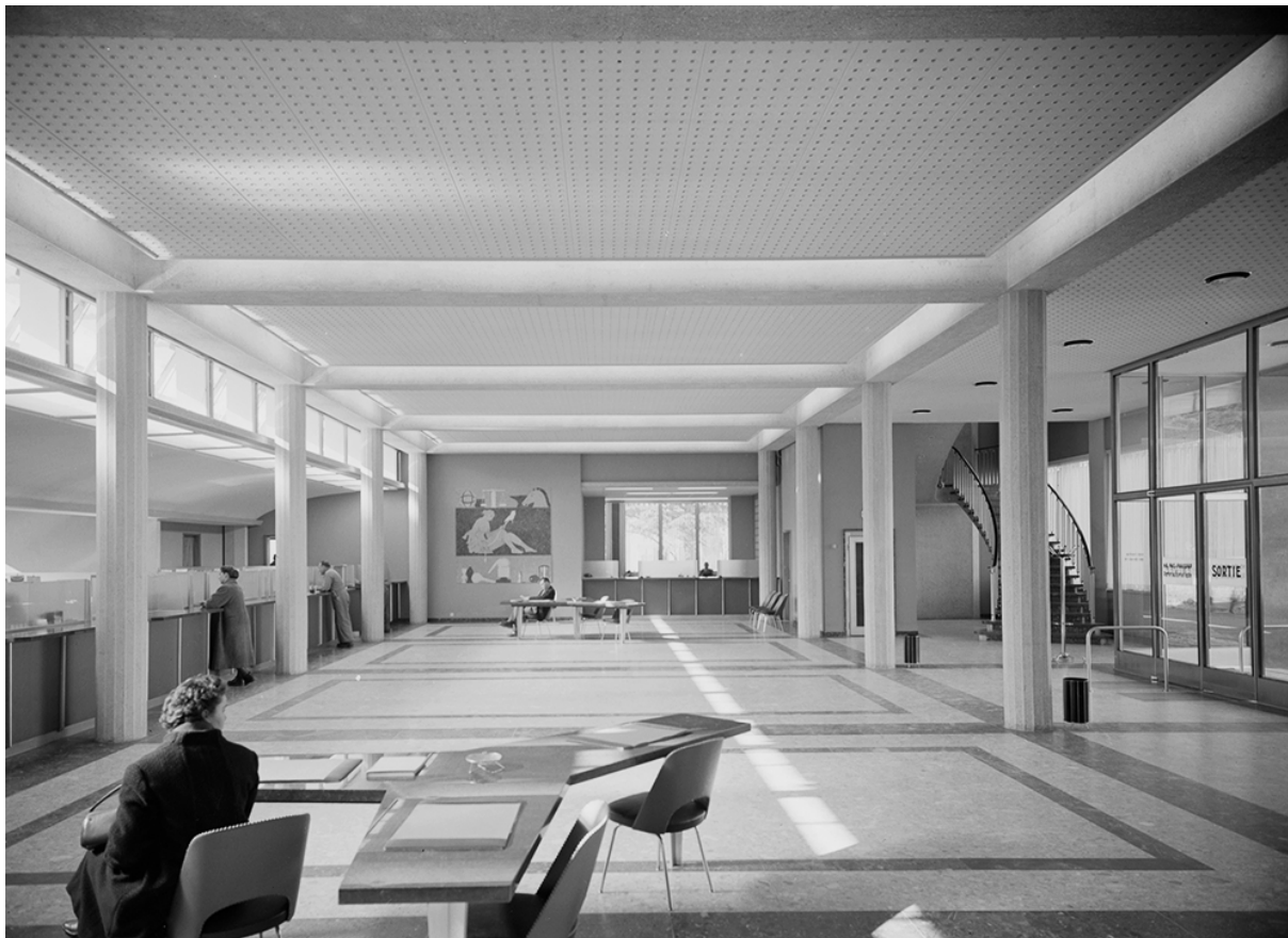
1956, photo du hall, extrait du livre, Jean Suter, Un pionnier de l'architecture moderne en Valais (Etat du Valais)

Le hall d'entrée principal est aujourd'hui sur-dimensionné et ne répond plus aux besoins d'une banque moderne. Dans le cadre du concours, cet espace devra être repensé afin de fonctionner de manière autonome. Sa nouvelle affectation est laissée à la libre appréciation des concurrents mais devra se voir attribuer une fonction publique.